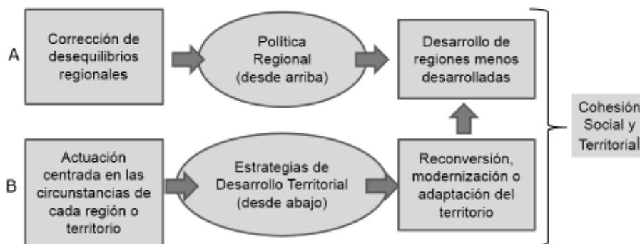
Figura 01 – Política regional y estrategias de desarrollo territorial

Por supuesto, existen vinculaciones necesarias entre ambos enfoques, ya que la utilización eficiente de los recursos canalizados por la Política Regional hacia los territorios o regiones más atrasadas requiere plantear y poner en marcha Estrategias de Desarrollo Territorial . Sin embargo, como se ha señalado, los dos enfoques tienen ámbitos de actuación, diseño de políticas y responsables diferentes. Las medidas de Política Regional son, básicamente, competencia de la Administración Central del Estado y suelen responder a una lógica descendente (“desde arriba”). En cambio, el segundo enfoque es un planteamiento estratégico, impulsado básicamente por los actores territoriales (“desde abajo”), y debería ser un objetivo compartido por los diferentes niveles de la Administración del Estado (Central, Regional, Provincial y Municipal), aunque no siempre se da esta complementariedad necesaria.